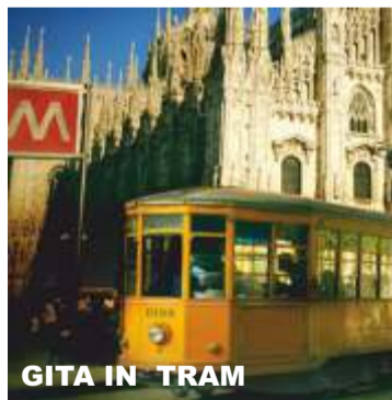
GITA IN TRAM

Il tram d'epoca diventa il palcoscenico per una rappresentazione teatrale itinerante. Gli attori di Dramatrà, con la loro abilità narrativa e interpretativa, raccontano storie e aneddoti sulla storia di Milano, sui suoi personaggi celebri e sui luoghi iconici che si incontrano lungo il percorso. Il viaggio attraverso la città, accompagnato dal ritmo del tram e dalle storie raccontate, offre una prospettiva diversa e immersiva di Milano, combinando il fascino del trasporto storico con la magia del teatro.