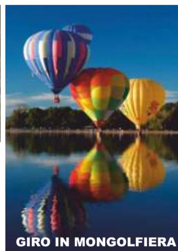
GIRO IN MONGOLFIERA

Le due bubble room, o cupole geodetiche, gioielli di comfort e design, sono dotate di una parete panoramica che si affaccia sulla natura circostante e che di notte regala l'emozione di dormire sotto le stelle. Ogni cupola dispone di un letto matrimoniale comodissimo, biancheria, aria condizionata, riscaldamento e un bagno privato. All'esterno, vi aspetta una spaziosa area relax con una vasca idromassaggio riscaldata ad uso esclusivo: il luogo perfetto per rilassarvi al tramonto o sotto il cielo stellato. Al mattino, una deliziosa colazione con prodotti freschi e genuini, provenienti dall'azienda agricola locale, vi verrà consegnata in una box direttamente nella vostra cupola. Pote-