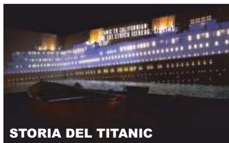
STORIA DEL TITANIC

Per ulteriori informazioni su queste iniziative: "Live in up"